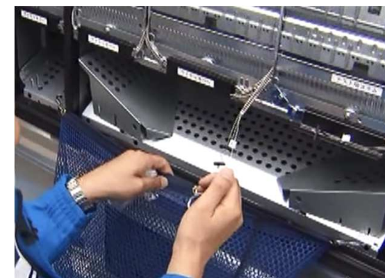
⑦災害支援自動販売機 (ワイヤー操作による貯蔵飲料提供の場合)