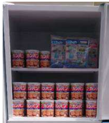
⑥災害対策用備蓄品